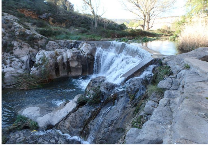
Azud de los Chorradores, Jérica