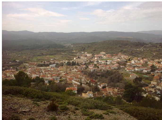
Viver, desde San Roque

Al llegar a un camino hormigonado podemos ir directamente hacia Viver, o mejor tomar una pequeña variante que nos lleva por un camino de tierra a la Fuente del Pontón, pasando previamente junto a la Balsa del Pontón que administra la parte del riego de Viver. La Fuente del Pontón está formada por varios nacimientos de agua dispersos por el suelo, ubicados por detrás del Lavadero. Enfrente podemos ver la depuradora municipal. Al poco estamos en la Fuente del Chorrillo, nuestro punto de partida. Cerca podemos ver los restos del cubo de vino de la Rocha Palmera.