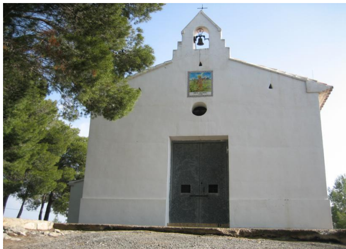
San Roque, Viver