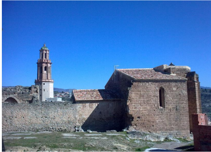
San Roque y la Torre Mudéjar, Jérica