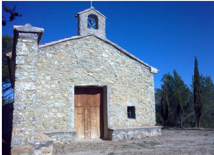
San Roque, Benafer