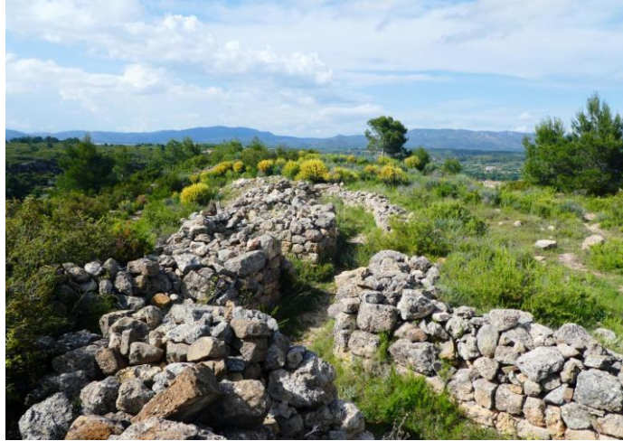
Conjunto de trincheras en Santa Cruz