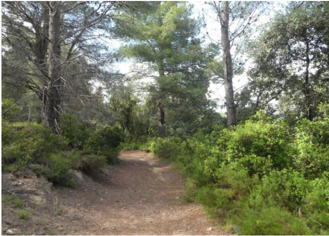
Tramo de la ruta, entre los Domingos y Santa Cruz

Autores: Francisco Molina, Pepe Juesas, Paco Mas. Fecha: junio de 2021.