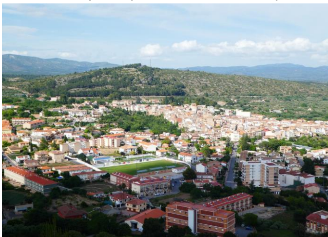
Vistas de Viver desde Santa Cruz, con San Roque detrás

Ahora descendemos del Alto de Santa Cruz para, cruzando la Rocha de Santa Cruz asfaltada, subir al cerro de enfrente, el de los Domingos, también plano y con buenas vistas del pueblo, con abundantes coscojas, entre las cuales se abre paso nuestra senda. Desembocamos en otra pista, la Rocha de Aguas Blancas, por la cual bajamos, y pasamos junto al Albergue de Aguas Blancas (antiguo Molino histórico), para seguir por caminos entre huertas, en la partida del Plano. Cuando llegamos al cauce del Barranco Hurón, lo acompañamos para llegar al casco urbano, y bajar al estupendo y frondoso paraje de la Floresta, que a su salida, nos deja junto al casco viejo, pudiendo pasear por el mismo, o volver ya al punto final, el Parque del Chorrillo.