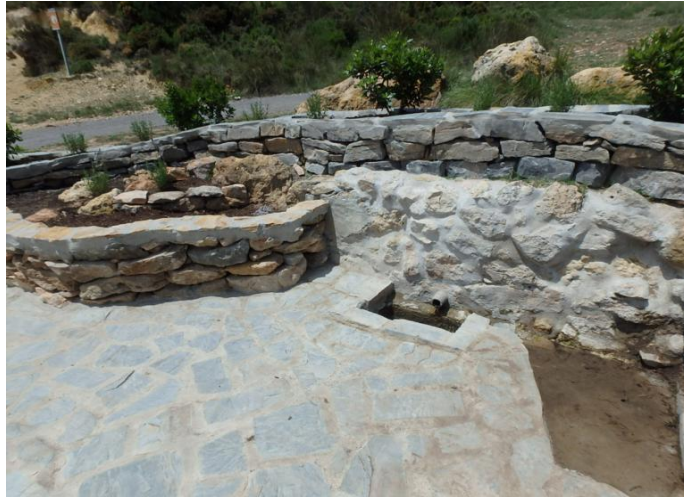
Fuente de Morredondo