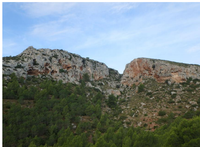
Las Peñas Royas o Cambras