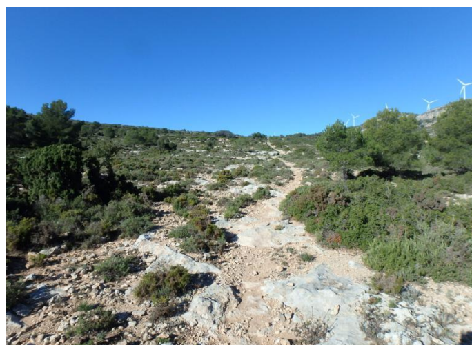
Hoya de las Caleras, con la senda que sigue el curso de la Colada de Monleón