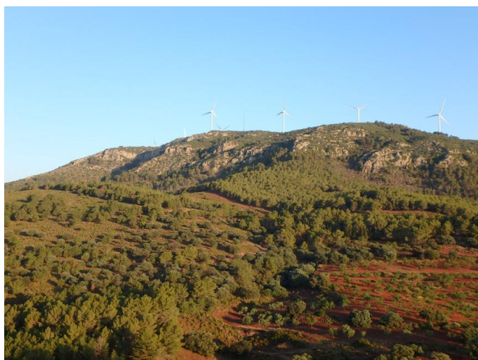
Montes de Ragudo, con los aerogeneradores

Aquí tomamos la Vía Verde de Ojos Negros, que seguimos un breve tramo, para dejarla tomando el amplio y cómodo Camino de Monleón. Recorreremos el camino bajo la sombra de los pinos (algunos muy maltratados por los temporales de 2017), dejando de lado las Casas o Masías de Monleón, casi todas en ruinas, así como el Pozo o Fuente (al cual podremos acercarnos si tenemos problemas de agua, aunque este punto ya no es del todo fiable). Tras atravesar la partida de la Hoya del Agua llegaremos al Collado de los Túneles, punto que salva las dos vías (tren y Verde). Aquí tomamos un carril por la izquierda que nos lleva por el rincón de Milhombres, lugar muy tranquilo y apacible, hasta devolvemos a la Vía Verde, por la cual y tras atravesar dos cortos túneles, volvemos a nuestro punto de partida en Masadas Blancas.