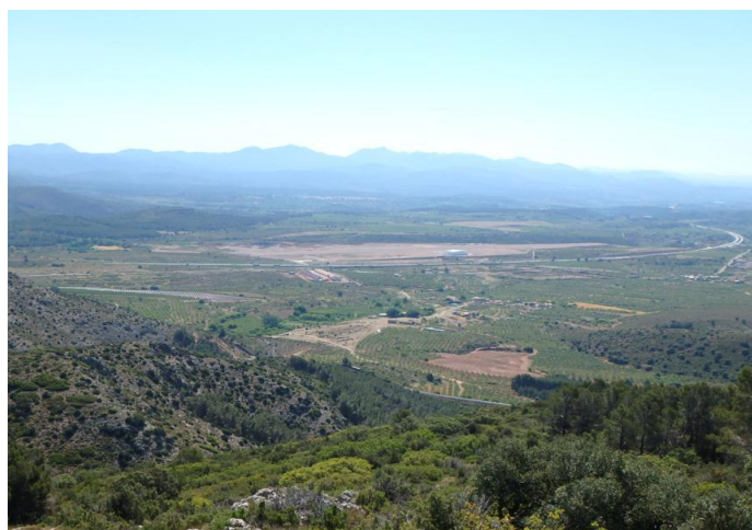
Vistas desde los Montes de Ragudo: Llanos centrales de Viver y Sierra Espadán al fondo