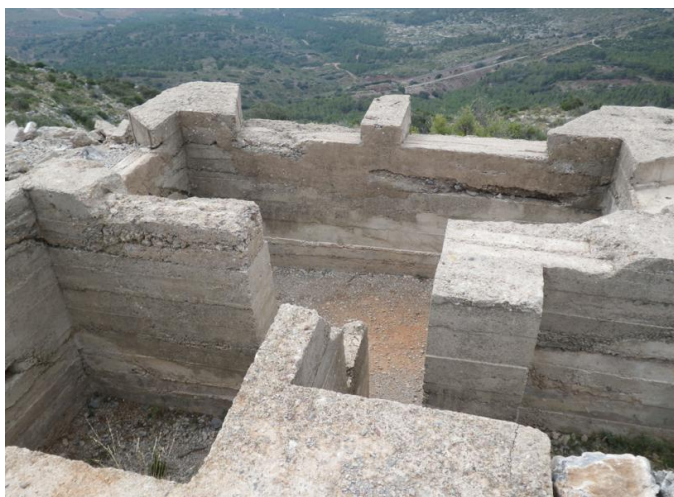
Búnker reacondicionado en las cumbres de Ragudo