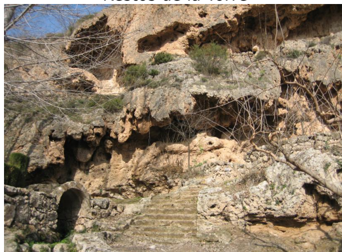
Cuevas del Sargal