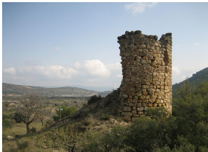
Restos de la Torre

Recomendamos asimismo visitar el Parque de la Floresta, otro agradable espacio recreativo situado dentro de la población, y muy cerca del Parque del Chorrillo. También proponemos ver la estructura del cubo de vino de la Rocha Palmera, situado cerca del Parque del Chorrillo.